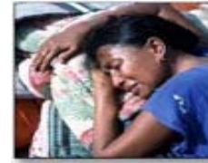
Women of Niger