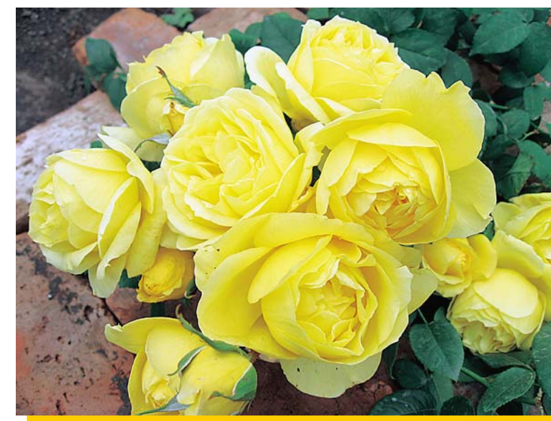
黄色いバラはゾンタのシンボルです